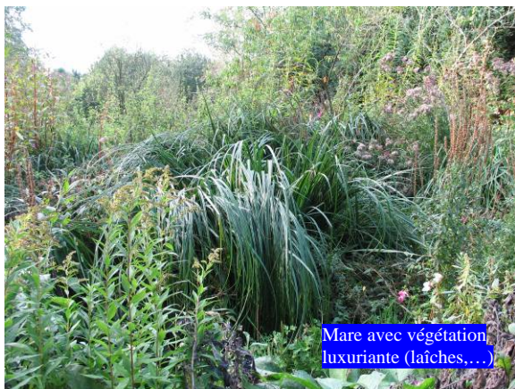
Mare avec végétation luxuriante (laïches,...)