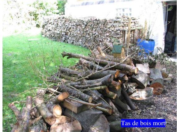
Tas de bois mort