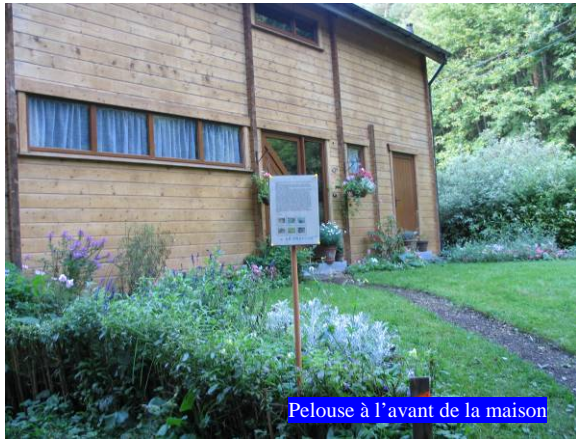
Pelouse à l'avant de la maison