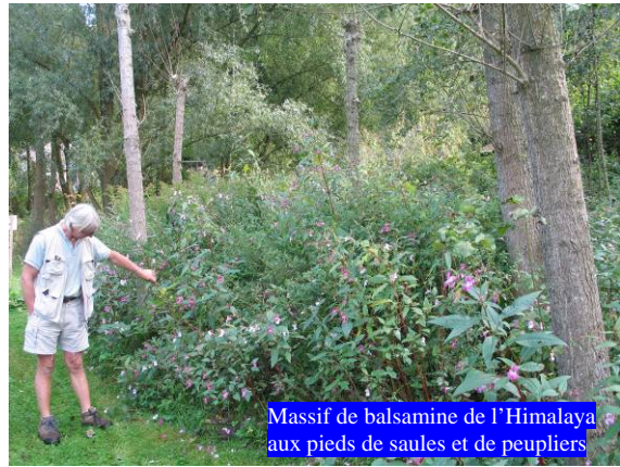
Massif de balsamine de l'Himalaya aux pieds de saules et de peupliers