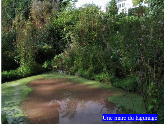
Une mare du lagunage